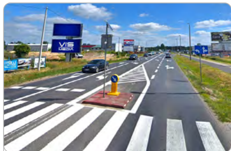
TORUŃ UL. POLNA 131 (1B)

1 tydzień 300 zł netto 2 tygodnie 450 zł netto Miesiąc 700 zł netto