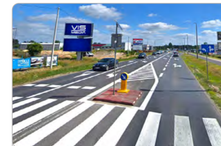
TORUŃ UL. POLNA 131 (1A)