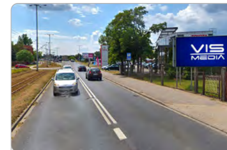
TORUŃ UL. M. SKŁODOWSKIEJ-CURIE 5 (1)