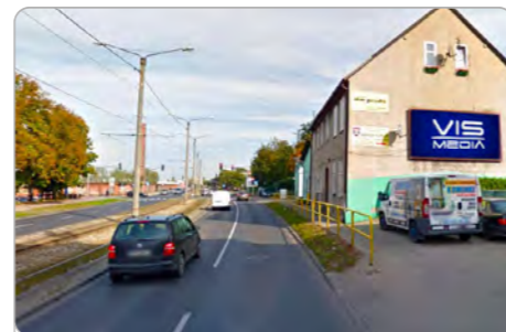
TORUŃ UL. SZOSA LUBICKA 46

1 tydzień 250 zł netto 2 tygodnie 400 zł netto Miesiąc 600 zł netto