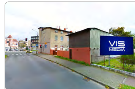
TORUŃ UL. LELEWELA 50

1 tydzień 250 zł netto 2 tygodnie 400 zł netto Miesiąc 600 zł netto