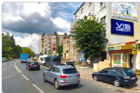
TORUŃ UL. SZOSA CHEŁMIŃSKA 44

1 tydzień 250 zł netto 2 tygodnie 400 zł netto Miesiąc 600 zł netto