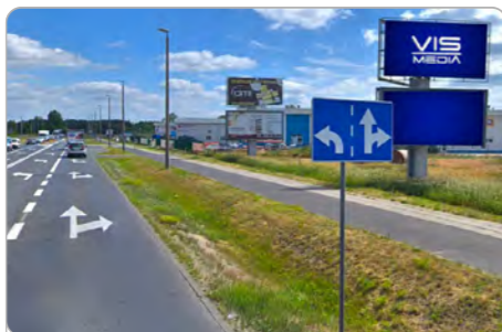
TORUŃ UL. POLNA 146 (4A)

1 tydzień 300 zł netto 2 tygodnie 450 zł netto Miesiąc 700 zł netto