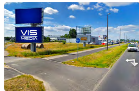
TORUŃ UL. POLNA 146 (5D)