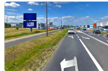
TORUŃ UL. POLNA 146 (4D)

1 tydzień 300 zł netto 2 tygodnie 450 zł netto Miesiąc 700 zł netto