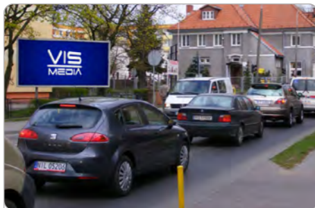
TORUŃ UL. LEGIONÓW 65

1 tydzień 250 zł netto 2 tygodnie 400 zł netto Miesiąc 600 zł netto