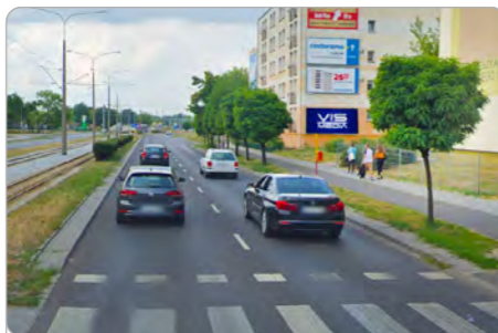
TORUŃ UL. BRONIEWSKIEGO 88