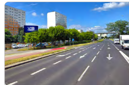
TORUŃ UL. SZOSA LUBICKA 175

1 tydzień 250 zł netto 2 tygodnie 400 zł netto Miesiąc 600 zł netto