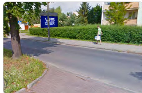
TORUŃ UL. LELEWELA 13

1 tydzień 250 zł netto 2 tygodnie 400 zł netto Miesiąc 600 zł netto