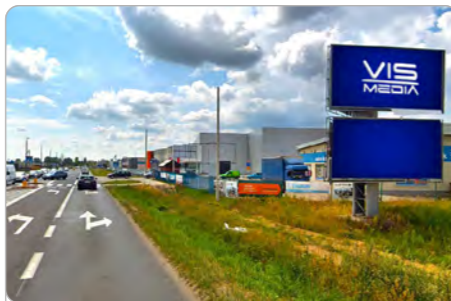
TORUŃ UL. POLNA 131 (1C)

1 tydzień 300 zł netto 2 tygodnie 450 zł netto Miesiąc 700 zł netto