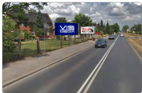
TORUŃ UL. M. SKŁODOWSKIEJ- CURIE 5 (2)

1 tydzień 250 zł netto 2 tygodnie 400 zł netto Miesiąc 600 zł netto