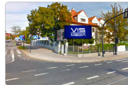
TORUŃ UL. WARSZAWSKA 22

1 tydzień 250 zł netto 2 tygodnie 400 zł netto Miesiąc 600 zł netto