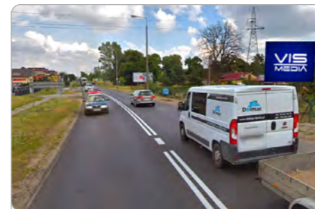
TORUŃ UL. POZNAŃSKA 319