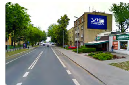
TORUŃ UL. REJA 37