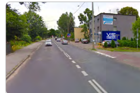
TORUŃ UL. ŁÓDZKA 23

1 tydzień 250 zł netto 2 tygodnie 400 zł netto Miesiąc 600 zł netto