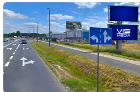
TORUŃ UL. POLNA 146 (4B)

1 tydzień 300 zł netto 2 tygodnie 450 zł netto Miesiąc 700 zł netto