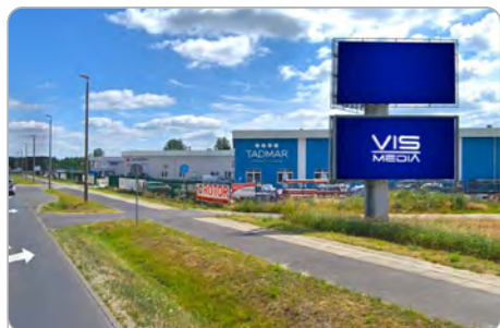
TORUŃ UL. POLNA 146 (5B)