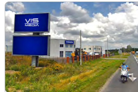
TORUŃ UL. POLNA 131 (3A)

1 tydzień 300 zł netto 2 tygodnie 450 zł netto Miesiąc 700 zł netto