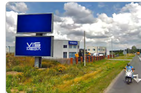
TORUŃ UL. POLNA 131 (3B)

1 tydzień 300 zł netto 2 tygodnie 450 zł netto Miesiąc 700 zł netto