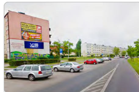
TORUŃ UL. GAGARINA 202-208