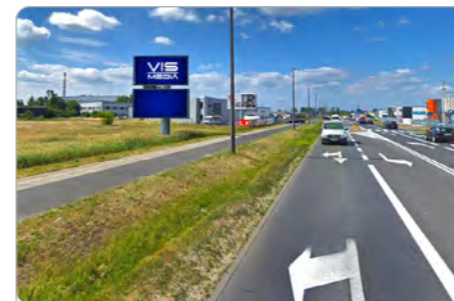
TORUŃ UL. POLNA 146 (4C)

1 tydzień 300 zł netto 2 tygodnie 450 zł netto Miesiąc 700 zł netto