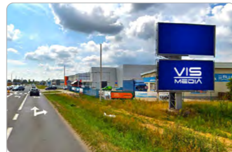
TORUŃ UL. POLNA 131 (1D)

1 tydzień 300 zł netto 2 tygodnie 450 zł netto Miesiąc 700 zł netto