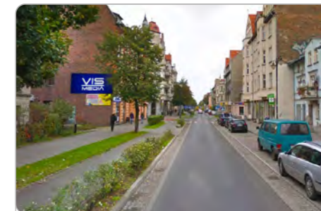
TORUŃ UL. MICKIEWICZA 82

1 tydzień 250 zł netto 2 tygodnie 400 zł netto Miesiąc 600 zł netto