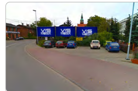
TORUŃ UL. PODGÓRNA 66