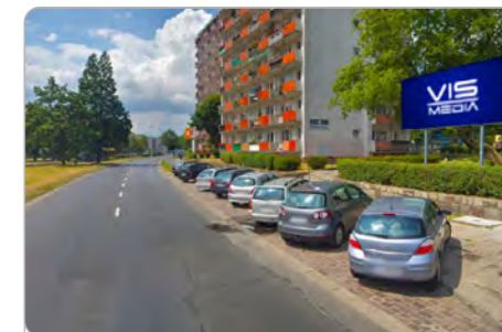
TORUŃ UL. KRASZEWSKIEGO 2