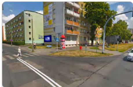
TORUŃ UL. KRASZEWSKIEGO 32-34

1 tydzień 250 zł netto 2 tygodnie 400 zł netto Miesiąc 600 zł netto