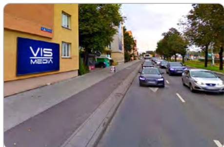
TORUŃ UL. ODRODZENIA