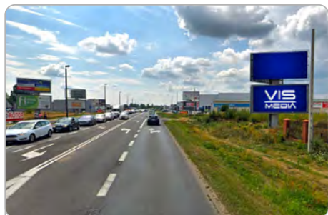
TORUŃ UL. POLNA 131 (3D)

1 tydzień 300 zł netto 2 tygodnie 450 zł netto Miesiąc 700 zł netto