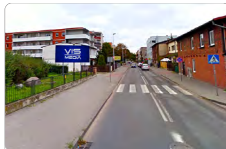
TORUŃ UL. PODGÓRNA 15-23