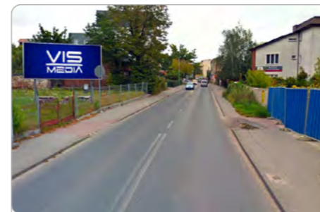
TORUŃ UL. PODGÓRNA 42