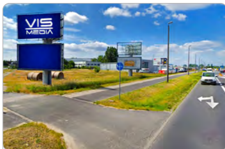
TORUŃ UL. POLNA 146 (5C)