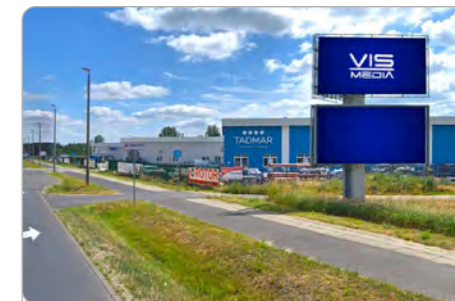
TORUŃ UL. POLNA 146 (5A)

1 tydzień 300 zł netto 2 tygodnie 450 zł netto Miesiąc 700 zł netto