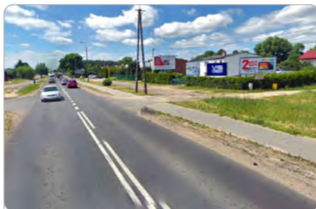
TORUŃ UL. OLSZTYŃSKA