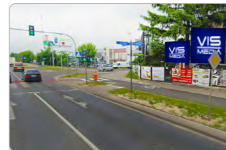
TORUŃ UL. GRUDZIĄDZKA 180