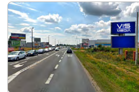
TORUŃ UL. POLNA 131 (3C)

1 tydzień 300 zł netto 2 tygodnie 450 zł netto Miesiąc 700 zł netto